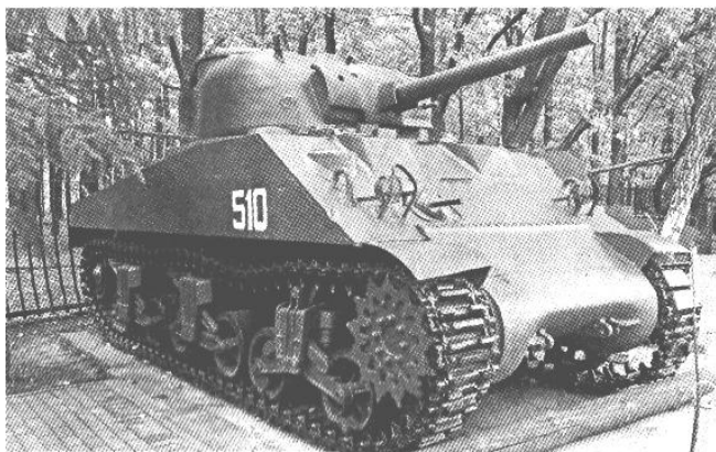
Танк «Шерман» М4А2